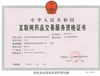
互联网药品交易服务资格证书