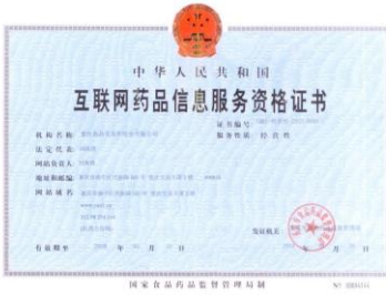
互联网药品信息服务资格证书 经营性/非经营性